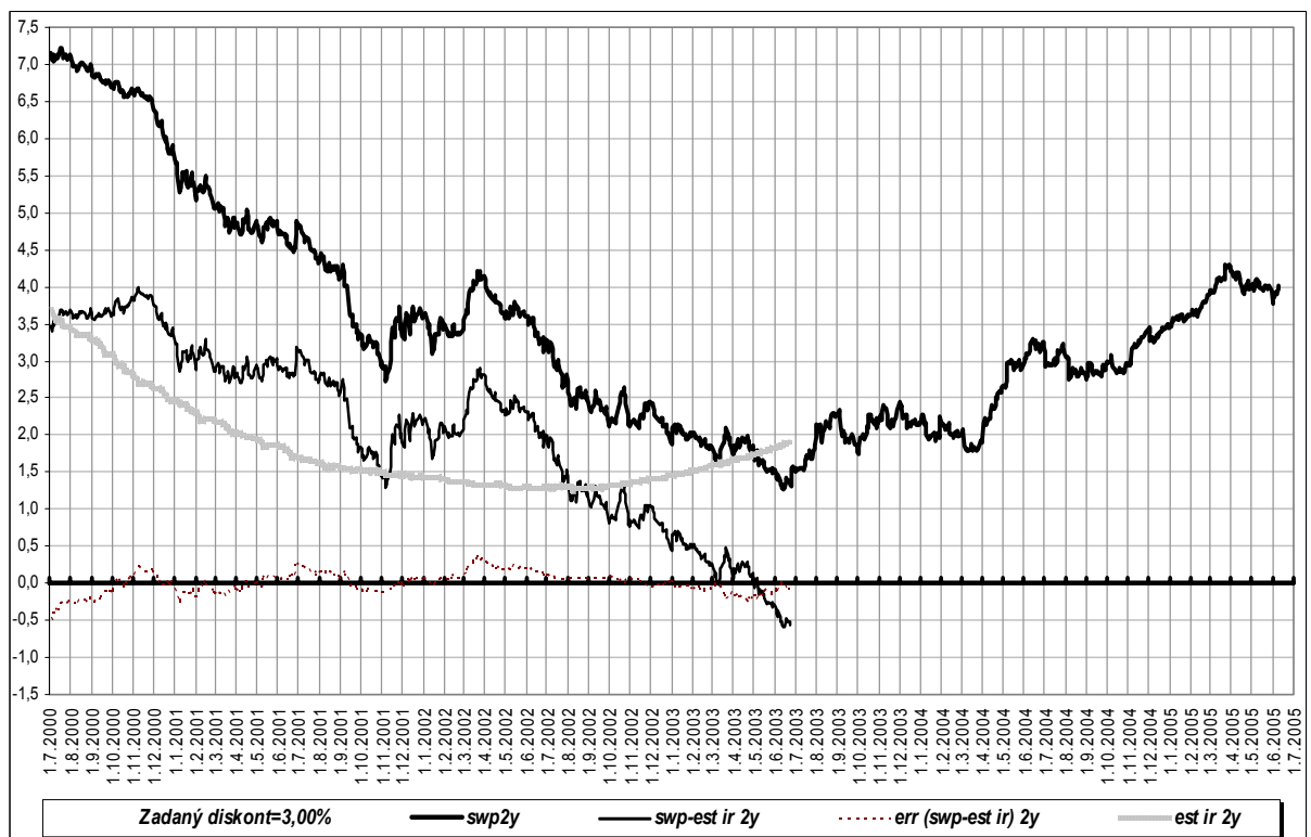
Obrázek č. 2: Průběhy jednotlivých časových řad vstupujících a vystupujících ve vztahu (2). Horní je záznam kurzu swp 2Y na 3M LIBOR-USD, pod ním je průběh pravé strany vztahu (2), šedý je průběh \frac{1}{n} \sum_{j=1}^n \frac{i_{t+j\Delta}}{(1+d\Delta)^j} , čárkovaný kolem nulové osy je průběh chyby \varepsilon_{t,T,d} ze vztahu (2).

Časové průběhy jednotlivých veličin následují na obrázku č. 2.